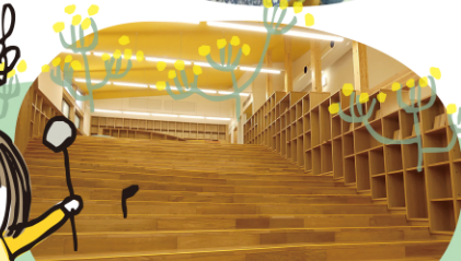
お気に入りの絵本にあってね