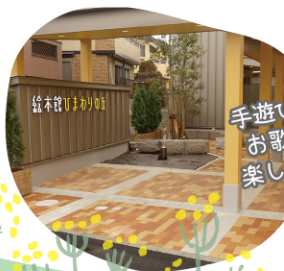
手遊びや お歌で 楽しもう