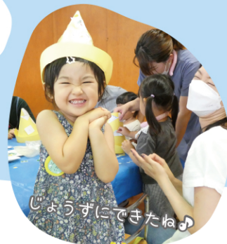
じょうずにできたね♪