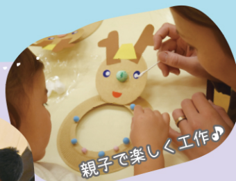
親子で楽しく工作♪